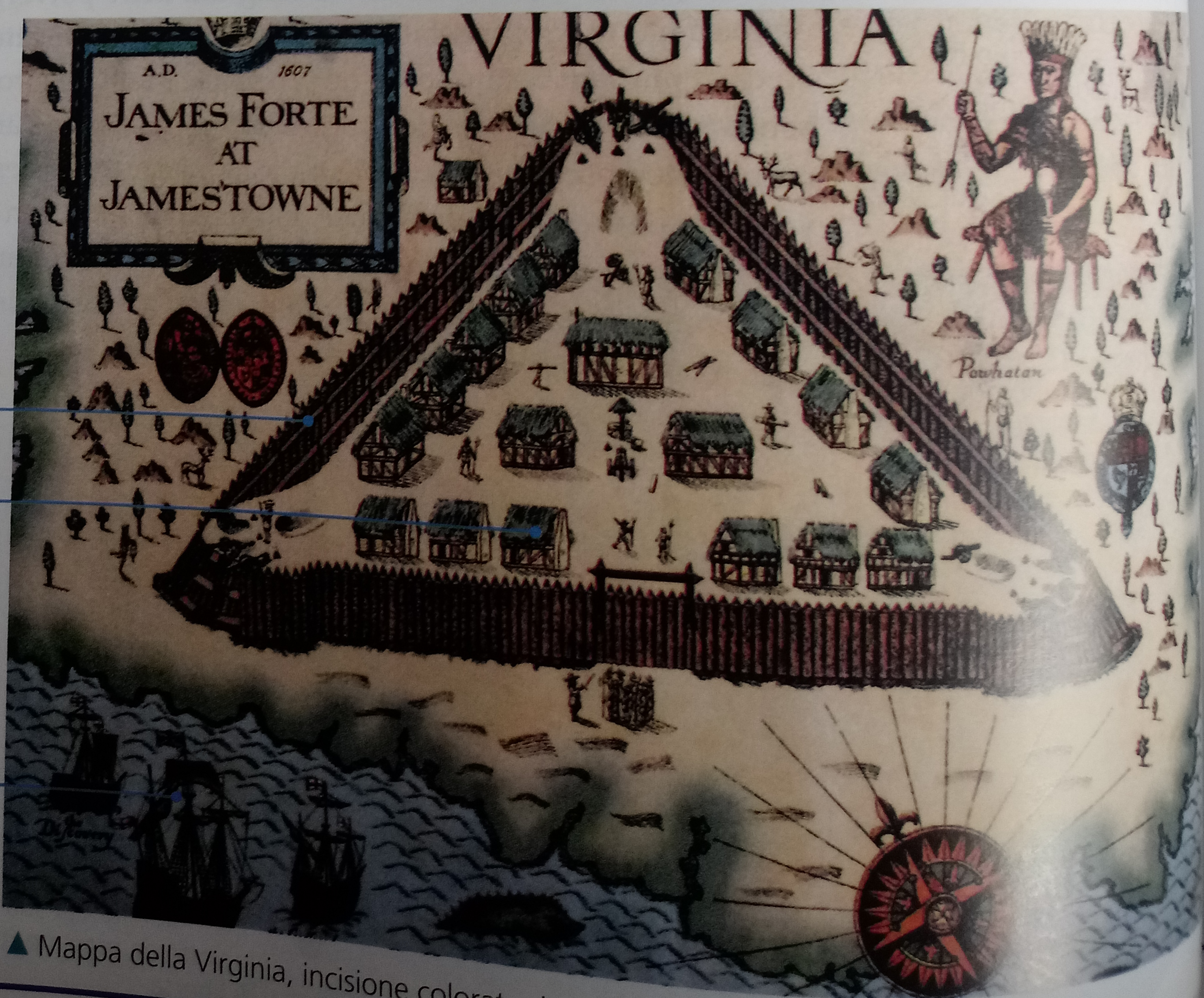
▲ Mappa della Virginia, incisione colorata del 1607

I tre vascelli con cui i 105 marinai e mercanti inglesi raggiungono le coste della Virginia.