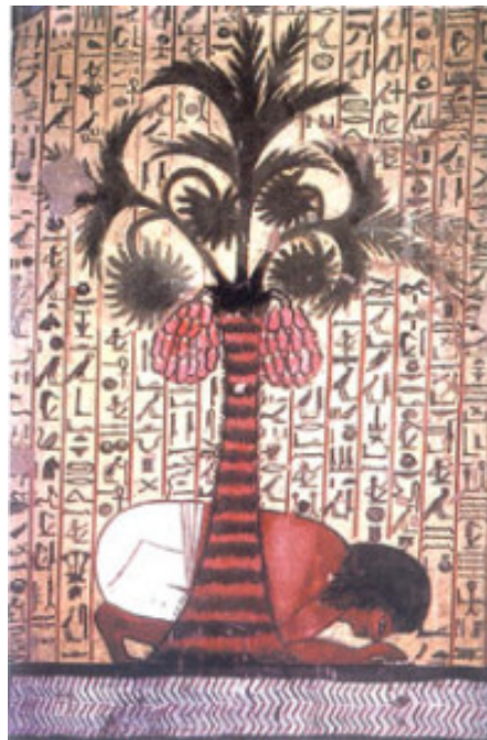
Albero sacro per gli Egizi

La sacralità della palma risale a prima dell'avvento del Cristianesimo. Nella mitologia greca la palma è una pianta solare, in quanto essa è sacra ad Apollo : si racconta che Latona, giunta a Delo, partorì il dio della luce appoggiandosi ai tronchi di due palme. Nella mitologica fondazione di Roma , la palma è legata al sogno premonitore di Rea Silva che vide due palme di smisurata grandezza ergersi fino al cielo, presagio della nascita di Romolo e Remo.