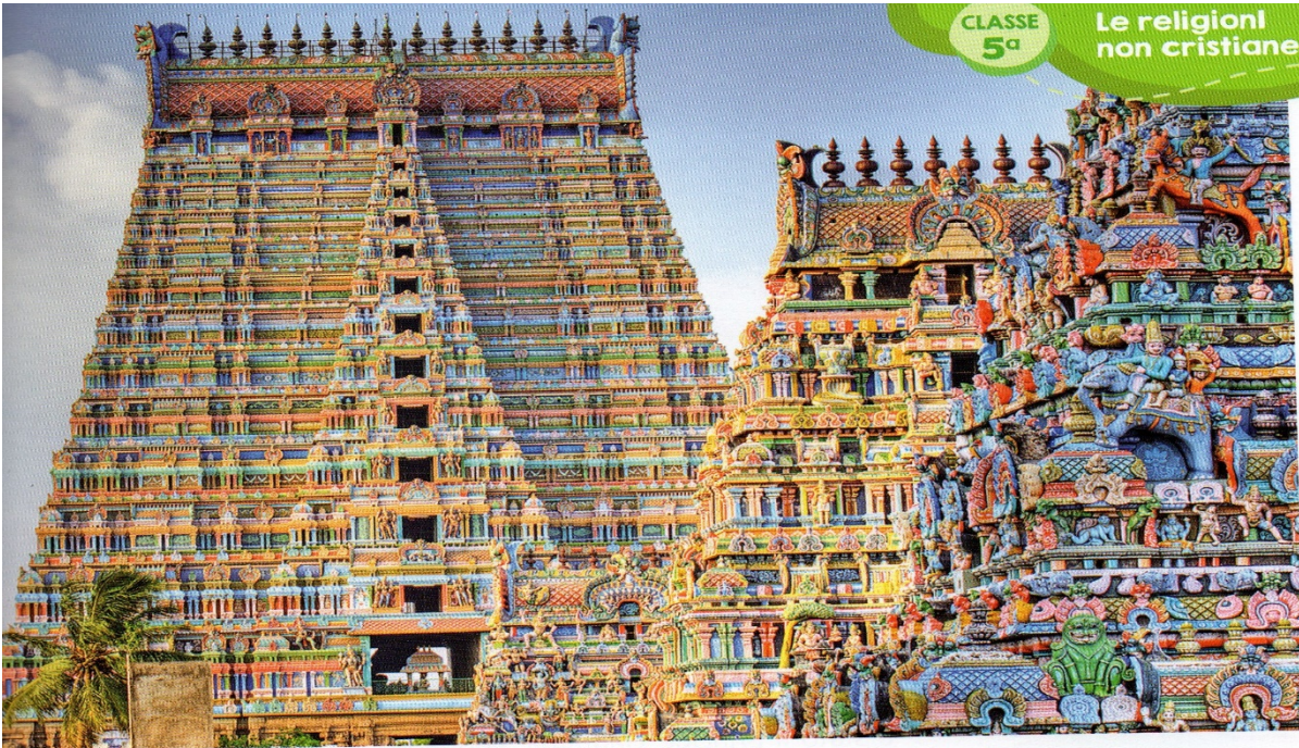
io indù di Srirangam in India.