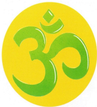
Il simbolo dell'Om.